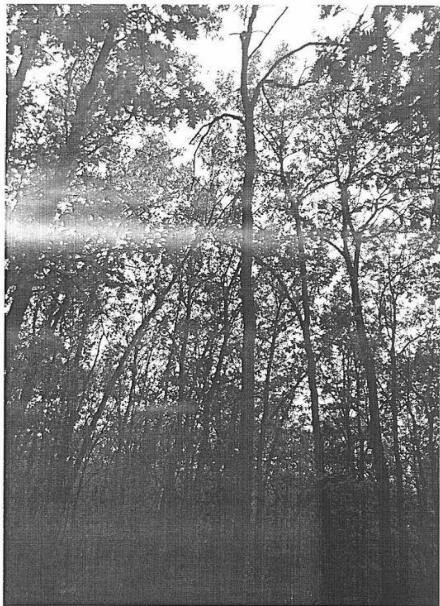
Departur Tudora Bund. Feb. 1921.